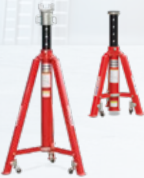
Faltbare Achsstützen Kapazitäten 8,5 bis 12 t