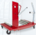
Radmontageegeräte Kapazitäten 0,5 / 1,5 t