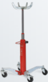
Getriebeheber Kapazitäten 0,3 bis 1,2 t